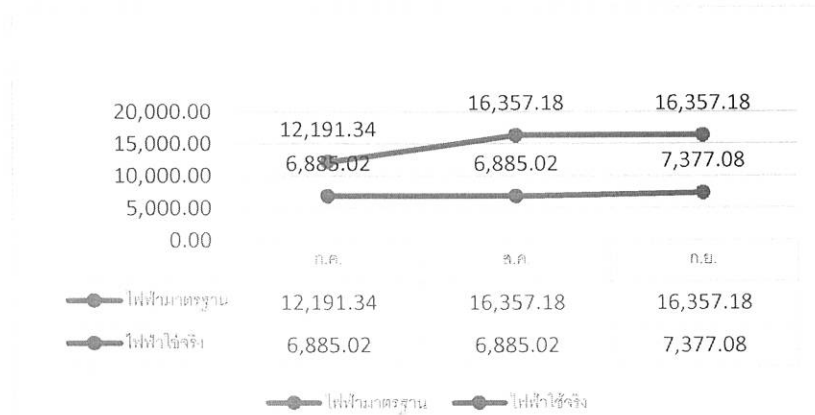
กราฟแสดงการใช้พลังงานไฟฟ้า (หน่วย) ปีงบประมาณ พ.ศ. ๒๕๖๔